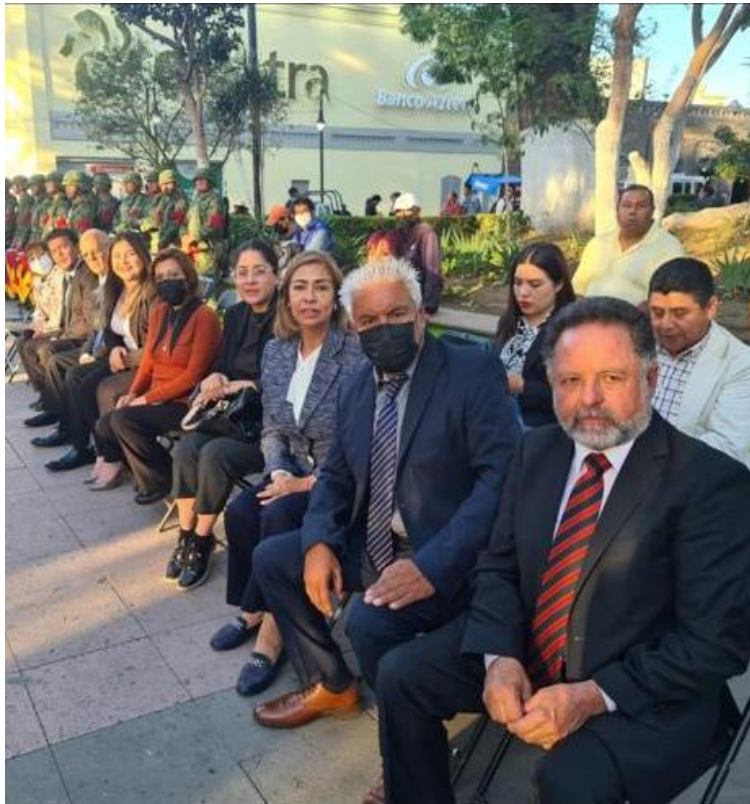
Honores a la Bandera Nacional y homenaje por el Día de la Bandera.